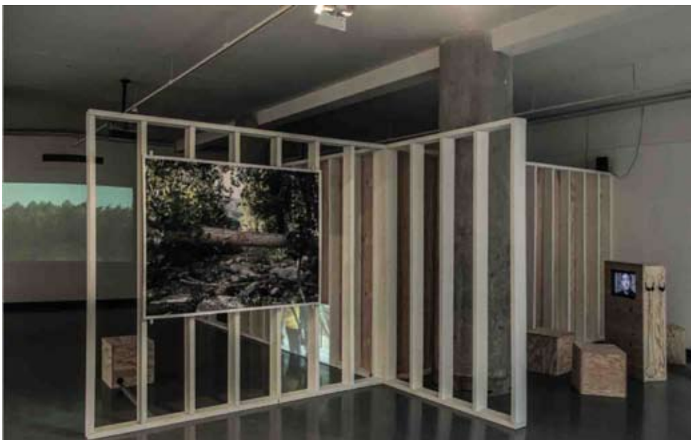
Entre-temps, Scénographie en collaboration avec les architectes Quentin Hatry, Robin Lamarche & Jean-Charles Giardina @ Espace le Carré, Lille, 2015