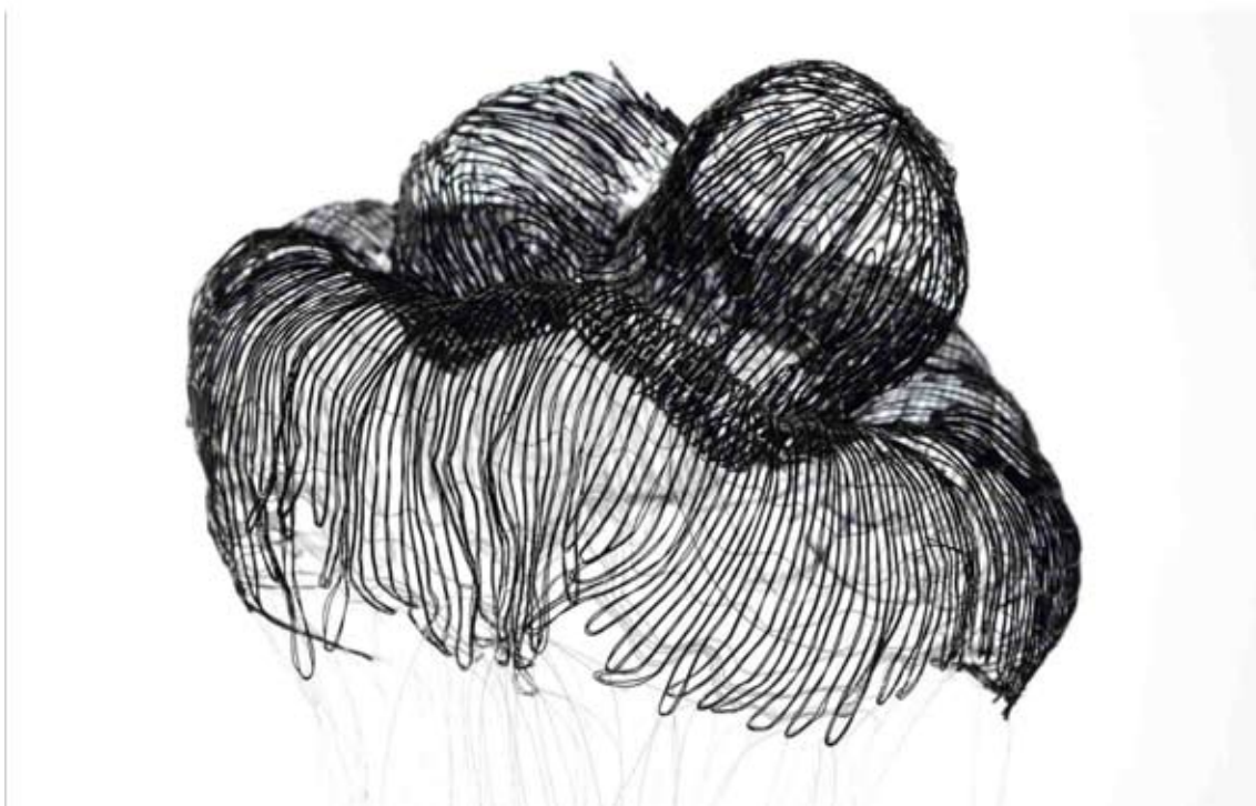
Twinkle Twinkle, Qubo Gas en collaboration avec Mylène Salvador-Ross Bailleux, 2015 Sculptures en dentelle

Commande publique nationale du CNAP Collection Centre Pompidou, Paris Musée National d'Art Moderne Centre de Création Industrielle