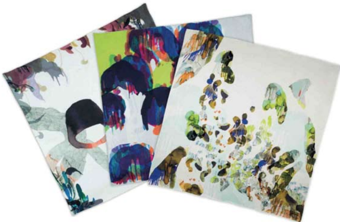
Mandrake, Yoyo & Olympia, Qubo Gas, 2014

Foulard en soie, rouloté main pour l'éditeur Petite Friture @ Paris