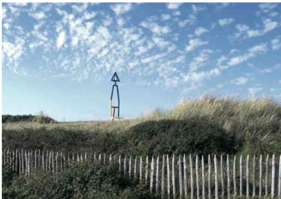
L'état des choses, ensemble de sculptures le long d'un parcours Julien Boucq @ SLACK ! DEUX CAPS ART FESTIVAL @ Site des Deux-Caps, 2015 - Production, artconnexion