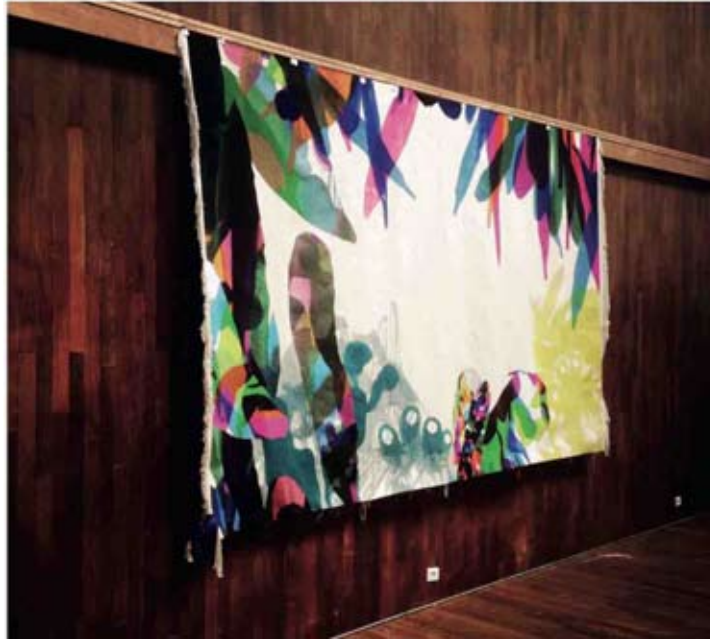
This Is A Light Out On The Horizon, Qubo Gas, 2015 Tapisserie d'Aubusson par les ateliers Pinton à Felletin initiée par Yves Sabourin du Ministère de la Culture. 250 x 350 cm

Commande publique nationale du CNAP Collection Centre Pompidou, Paris Musée National d'Art Moderne Centre de Création Industrielle